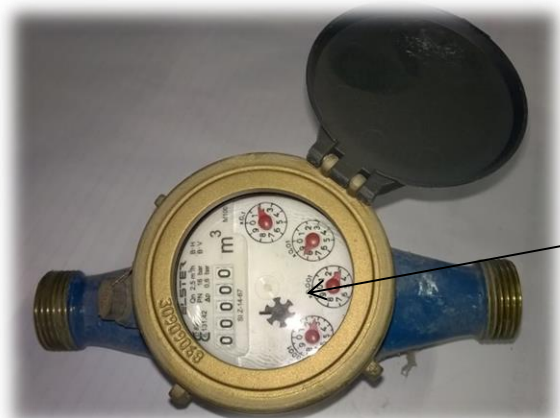
starejši tip vodomera

ČRNE ŠTEVILKE NA VODOMERU KAŽEJO KUBIČNE METRE, RDEČE PA LITRE PORABLJENE VODE